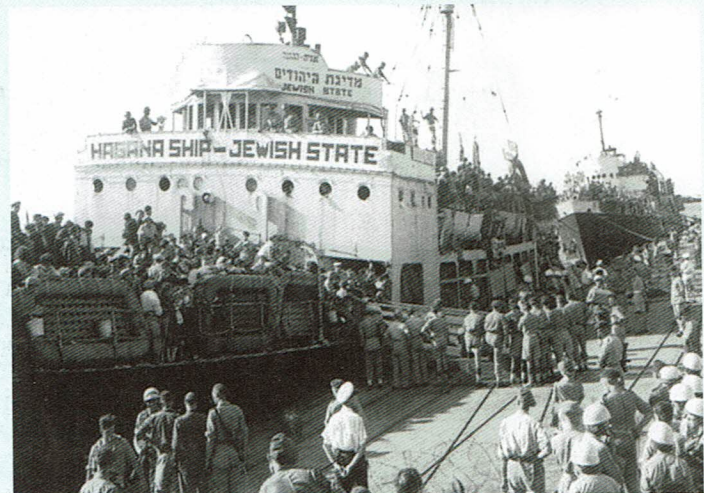
אוניית המעפילים "מדינת היהודים" 2,664 מעפילים

70 שנה להקמת הפלמ"ח 1941-2011, 70 שנה להקמת הגדנ"ע 1941-2011